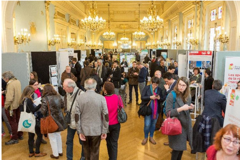
6ème Forum de l'éco-rénovation - Paris 31 janvier 2018

1er forum de la rénovation énergétique en copropriété Evry (91) – Vendredi 16 juin 2017